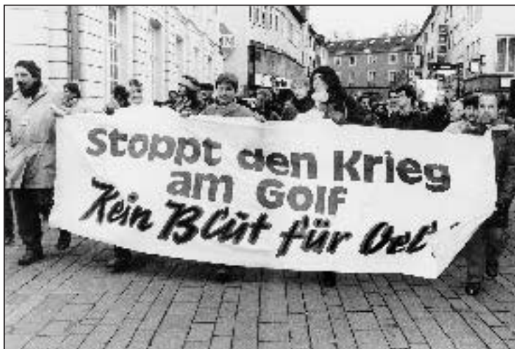
Motto auf der Demonstration in Bonn am 24.11.1990

An vielen US-Militärstützpunkten fanden bereits Demonstrationen statt, an einigen auch Sitzblockaden (Rhein-Main-Airbase/Frankfurt, EUCOM/Stuttgart). Neben Stuttgart Vaihingen, Ramstein, Rhein-Main Airbase Frankfurt, Spangdahlem, Heidelberg, Wiesbaden, Kaiserslautern, Würzburg, Grafenwöhr, Mannheim und Böblingen, wo jeweils US-Soldaten stationiert sind, die mit in