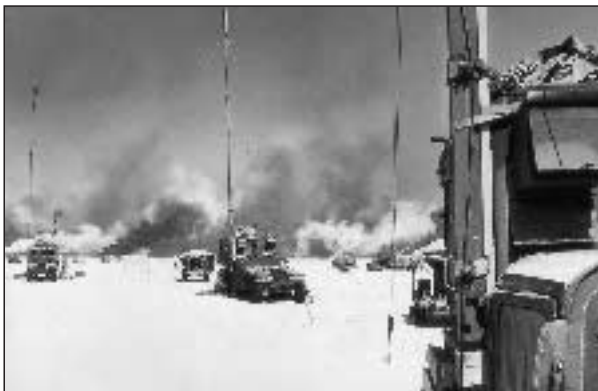
Aus einem Armee-Werbeprospekt

sentliche Rolle im Hintergrund des Oppositionstreffens in London. Seine Aufgaben liegen mehr im operationellen Bereich. Konzeptionell hat das einflussreiche `Deputies Committee` die Federführung übernommen. Die `Vizes` aus State Department, Pentagon, der Generalität, dem Nationalen Sicherheitsrat sowie dem Büro des Vizepräsidenten treffen sich regelmäßig im `Lageraum` des Weißen Hauses und arbeiten seit dem Herbst an einem Nachkriegsplan für das Zweistromland. Eine weitere Arbeitsgruppe im State Department, das bereits 1999 ge-