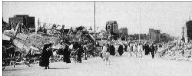
Kerbala (Irak) nach dem 2. Golfkrieg und dem Schiiten-Aufstand 1991

„Mit Awacs auf politischem Blindflug über Absurdistan“ lautete die Überschrift in der FR, 13.12.02: „Awacs-Flugzeuge, sagt der Kanzler, seien keine Instrumente, mit denen man operativ Krieg führen könne. Das stimmt so nicht. ... Die Awacs-Maschinen aber sind fliegende Gefechtsstände. ... Der verteidigungspolitische Sprecher der Uni-