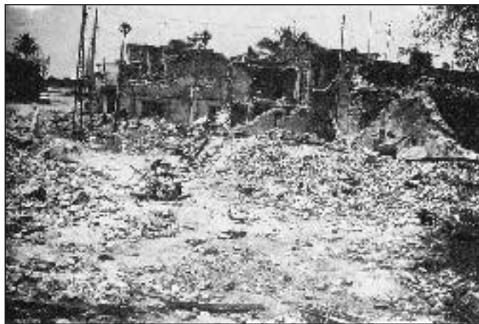
Basra (Irak) nach dem 2. Golfkrieg und dem Schiiten-Aufstand 1991