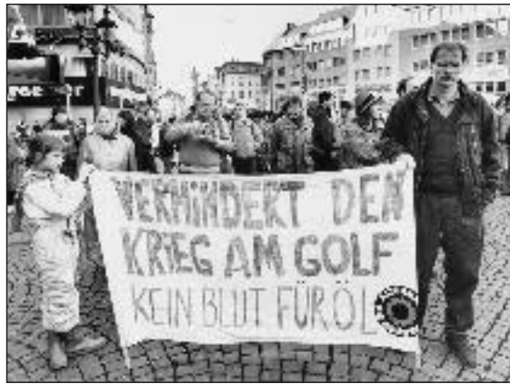
Demonstration in Bonn, 24.11.90: Stoppt den Krieg am Golf

über die Türkei, den Hafen Ceyhan, vielleicht auch über einen sich dem Westen zuneigenden Staat Syrien. Diese Pipelines sind vorhanden. Ich bin sicher, die Amerikaner träumen noch einen anderen Traum: Irakisches Öl soll eines Tages über Haifa in den Westen transportiert werden. ... Sechs Millionen Barrel pro Tag aus dem von US-Kriegsschiffen geschützten Mittelmeer zu transportieren, das ist durchaus möglich. Und das bedeutet dann für die USA energiepolitische