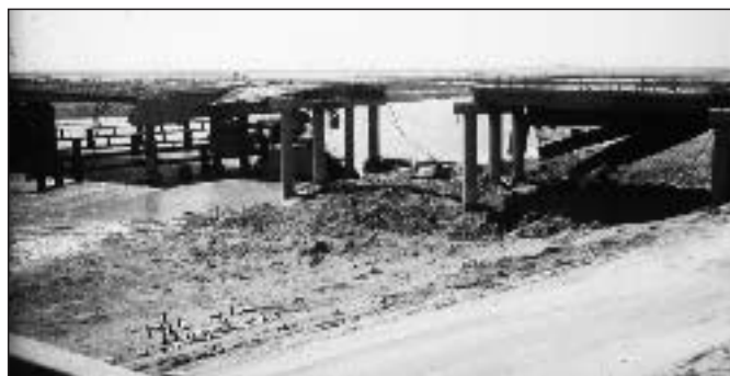
Tigrisbrücke nach dem 2. Golfkrieg und dem Schiiten-Aufstand 1991

3. Ölmultis als eigenständiger Spieler: Zwar sind die großen Ölfirmen, historisch gesehen, Produkte aus der Zeit des Imperialismus' und bis zum Zweiten Weltkrieg auch als machtpolitische Instrumente für nationalstaatliche Interessen eingesetzt worden. Doch die Globalisierung hat die Spielregeln grundsätzlich verändert. Ölmultis sind wirklich multinationale Unternehmen, deren Hauptaufgabe es ist, Geld zu verdienen, um ihre Aktionäre (Shareholders) zufriedener zu stellen. Dies können sie besser durch ihre internationale Verflechtung, als wenn sie an der Leine nationaler Regierungen agieren. Zwar legen sie Wert darauf, dass Staaten günstige Rahmenbedingungen schaffen (Sicherheit, verlässliche Rechtsordnung, niedrige Steuern und Zölle etc.), aber ihre Geschäftspartner suchen sie nach nicht-nationalen Kriterien aus. Deshalb drängen amerikanische Firmen nicht mehr als andere darauf, im Irak eine klare Geschäftsgrundlage zu schaffen. Möglicherweise drängen sie überhaupt nicht darauf, weil die Erschließung des Irak angesichts eines durchaus gesättigten Weltmarktes in der Tendenz den Ölpreis senkt und damit andere Engagements weniger rentabel macht. Es kann nicht im Interesse der USA liegen, die seit drei Jahren bestehende preisstabilisierende Politik der OPEC zu untergraben.