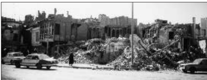
Kerbala (Irak) nach dem 2. Golfkrieg und dem Schiiten-Aufstand 1991

Das Verhalten Tony Blairs und George W. Bushs erinnert an eine Neuauflage der Kolonialpolitik vor rund einhundert Jahren.